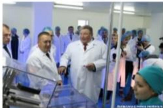
Глава Мордовии Владимир Волков и генеральный директор ОАО «Биохимик» Денис Швецов

Общий объем инвестиций в проект составил более 400 млн рублей