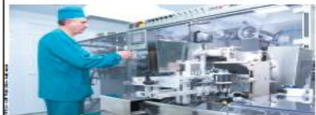
Новый производственный участок будет выпускать до 400 миллионов таблеток в год.

Предприятие «Биохимик» было основано в 1959 году в Мордовии. На сегодняшний день оно выпускает более 100 наименований лекарственных средств в инъекционных, таблетированных, ампульных и капсульных формах.