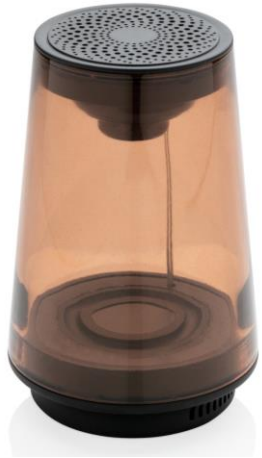
Беспроводная колонка Encore мощностью 5W, арт. 604P328.591