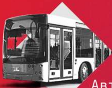
Автобус большой вместимости