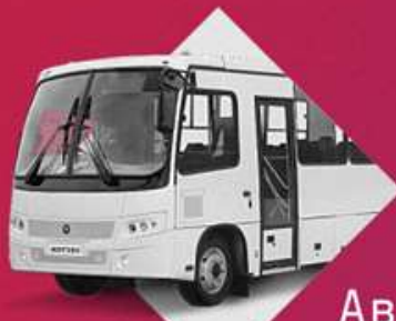
Автобус средней вместимости