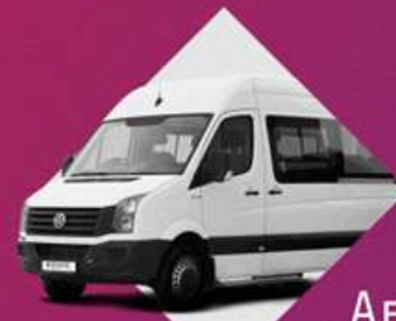
Автобус малой вместимости