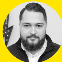
ЕВГЕНИЙ ШЕСТАКОВ Rush Agency