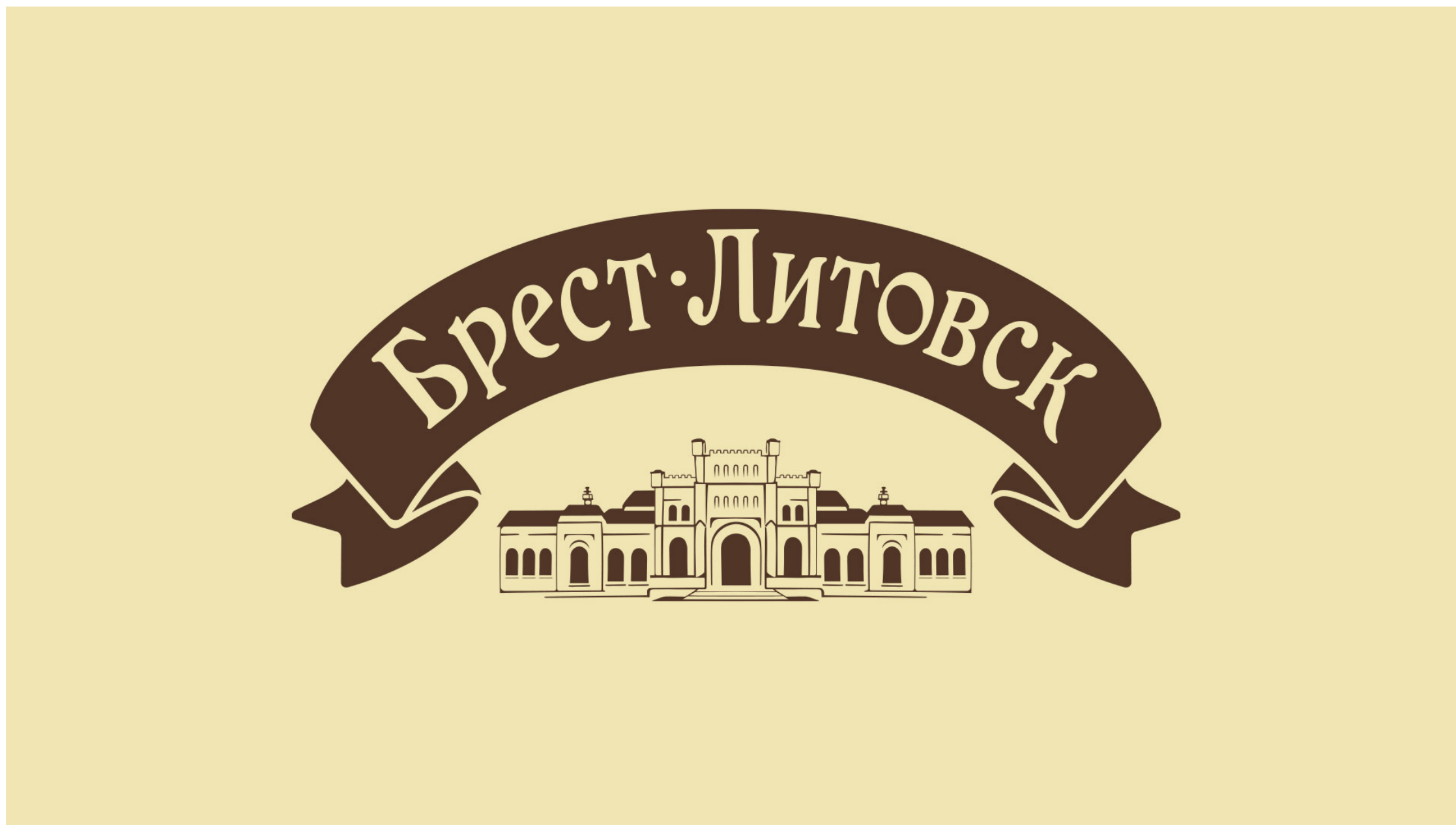
ПРОЕКТ: БРЕСТ-ЛИТОВСК | КЛИЕНТ: САВУШКИН ПРОДУКТ | КАТЕГОРИЯ: FOOD / DAIRY