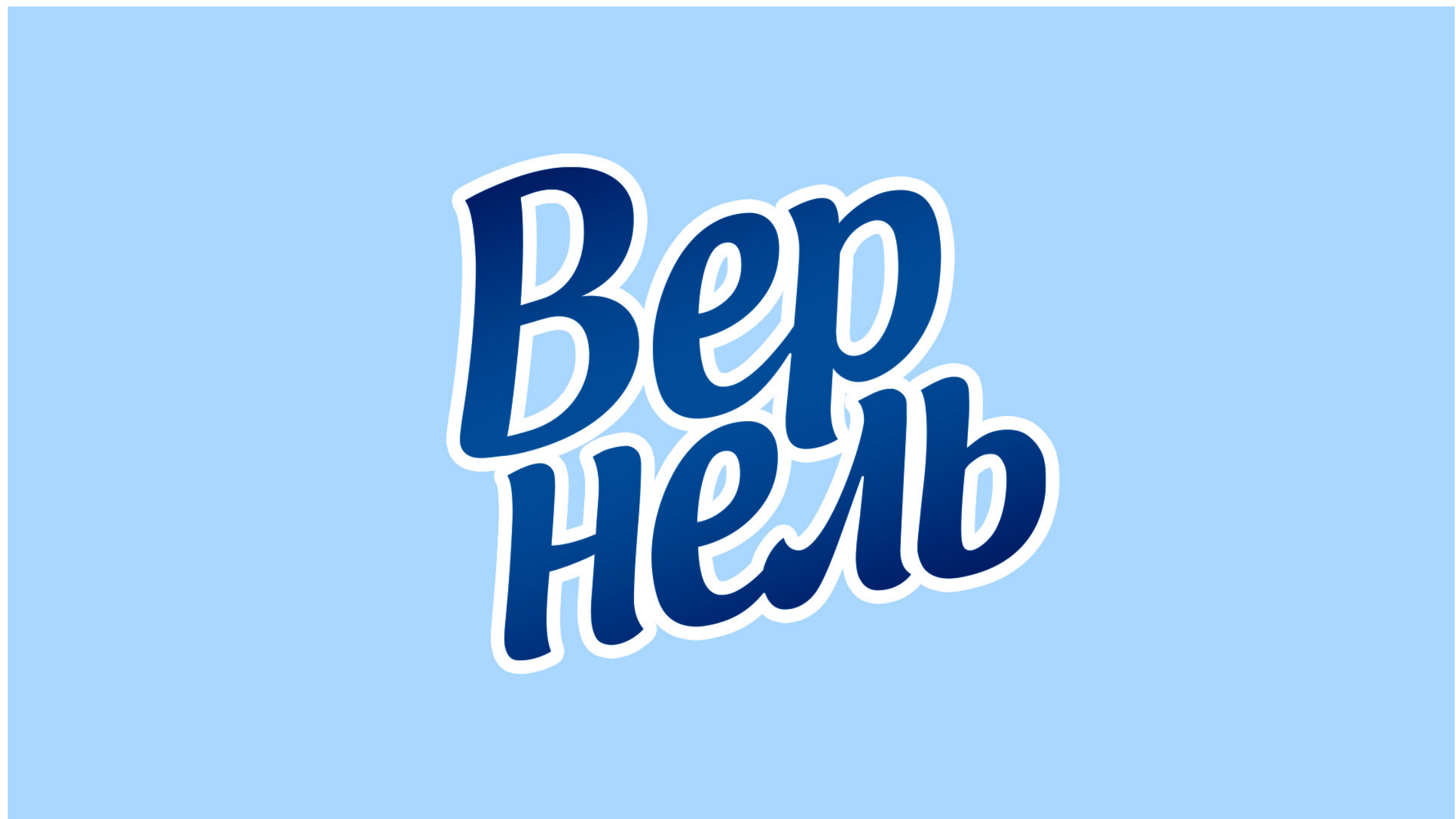
ПРОЕКТ: ВЕРНЕЛЬ | КЛИЕНТ: LAB INDUSTRIES | КАТЕГОРИЯ: NON FOOD / LAUNDRY