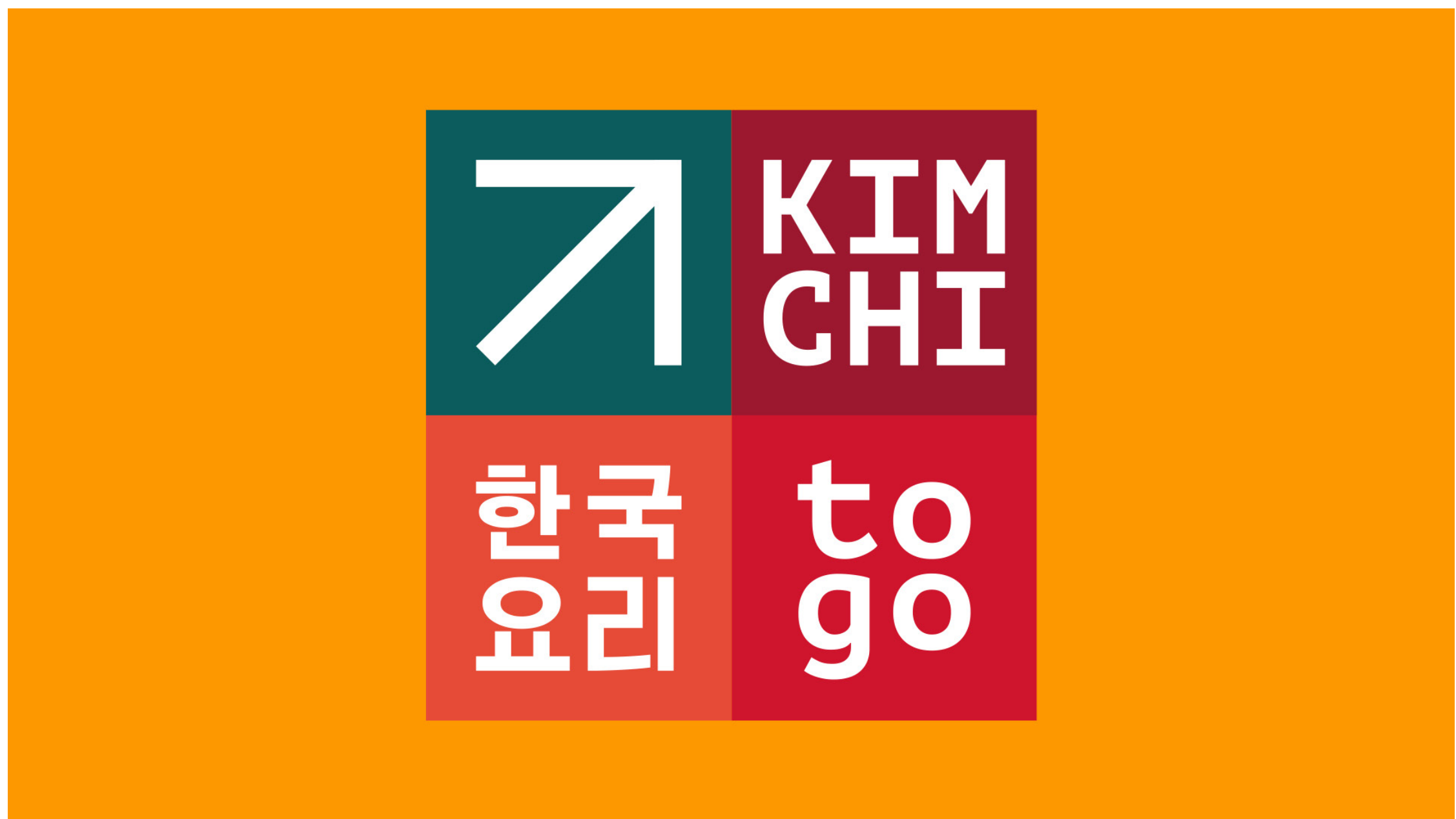
ПРОЕКТ: KIMCHI TO GO | КЛИЕНТ: KOREANA | КАТЕГОРИЯ: IDENTITY / HORECA