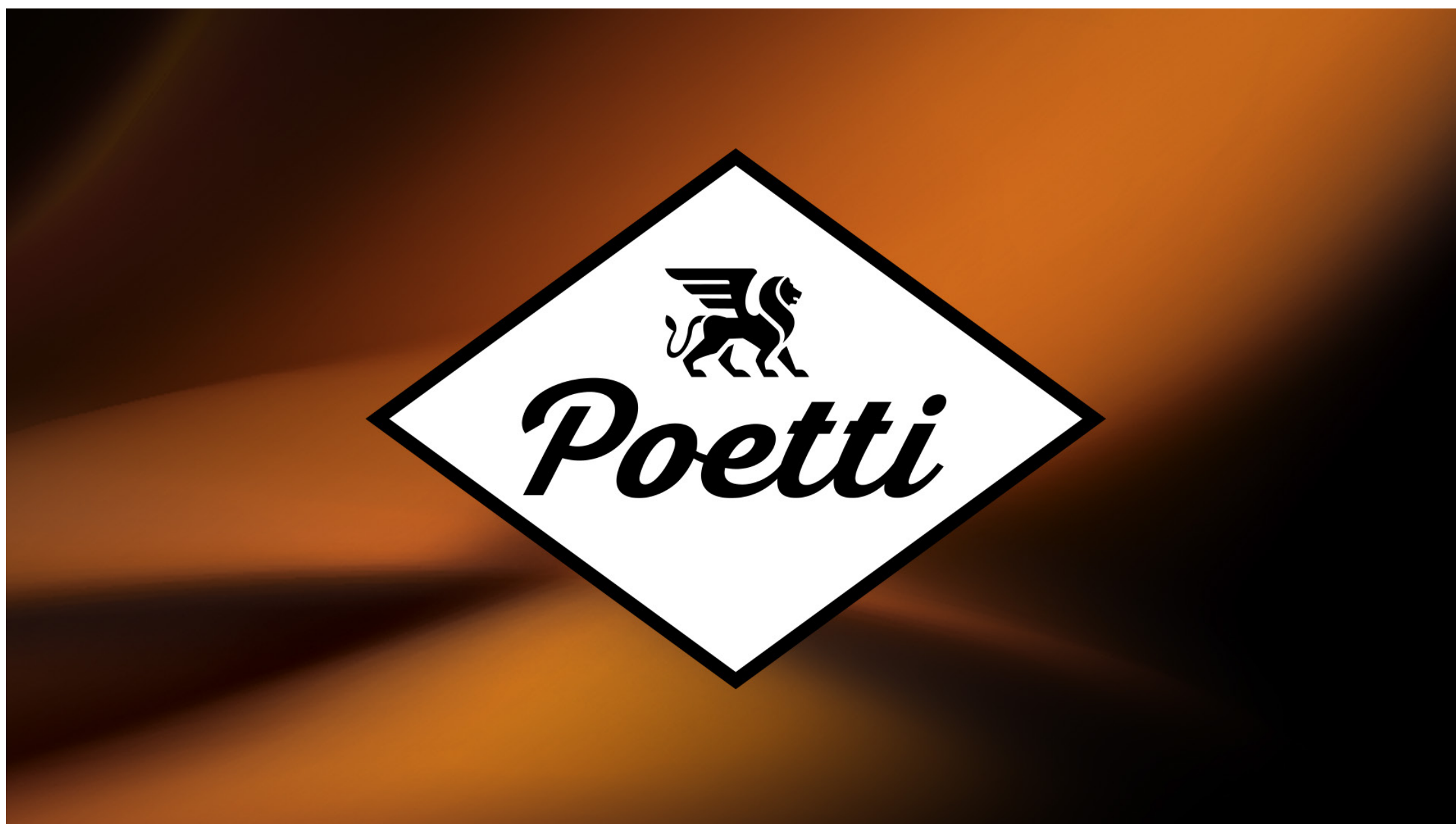
ПРОЕКТ: POETTI | КЛИЕНТ: МИЛФУДС | КАТЕГОРИЯ: FOOD / COFFEE