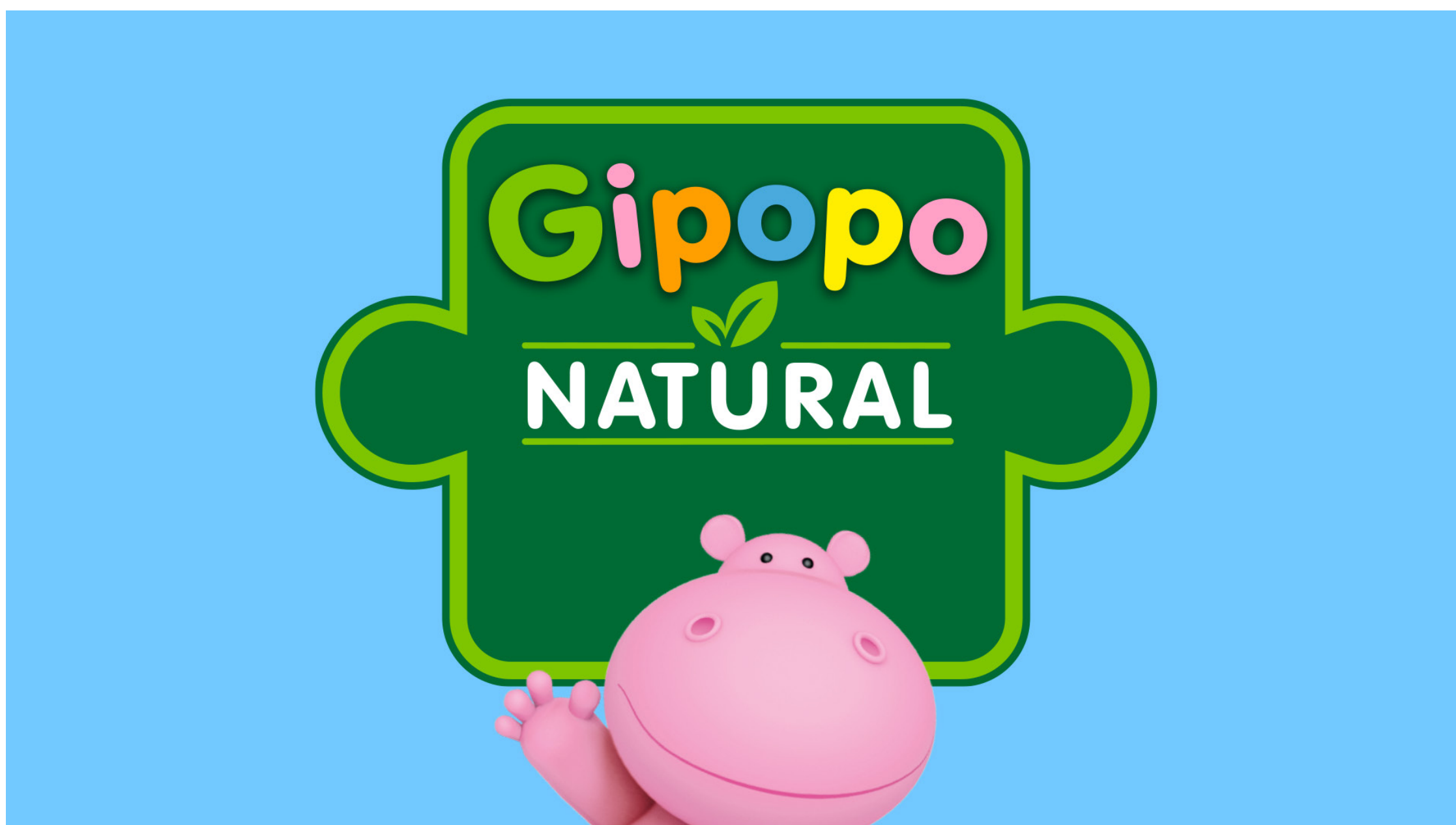
ПРОЕКТ: ГИПОРО | КЛИЕНТ: ГК ЧЕРНОГОЛОВКА | КАТЕГОРИЯ: FOOD / KIDS