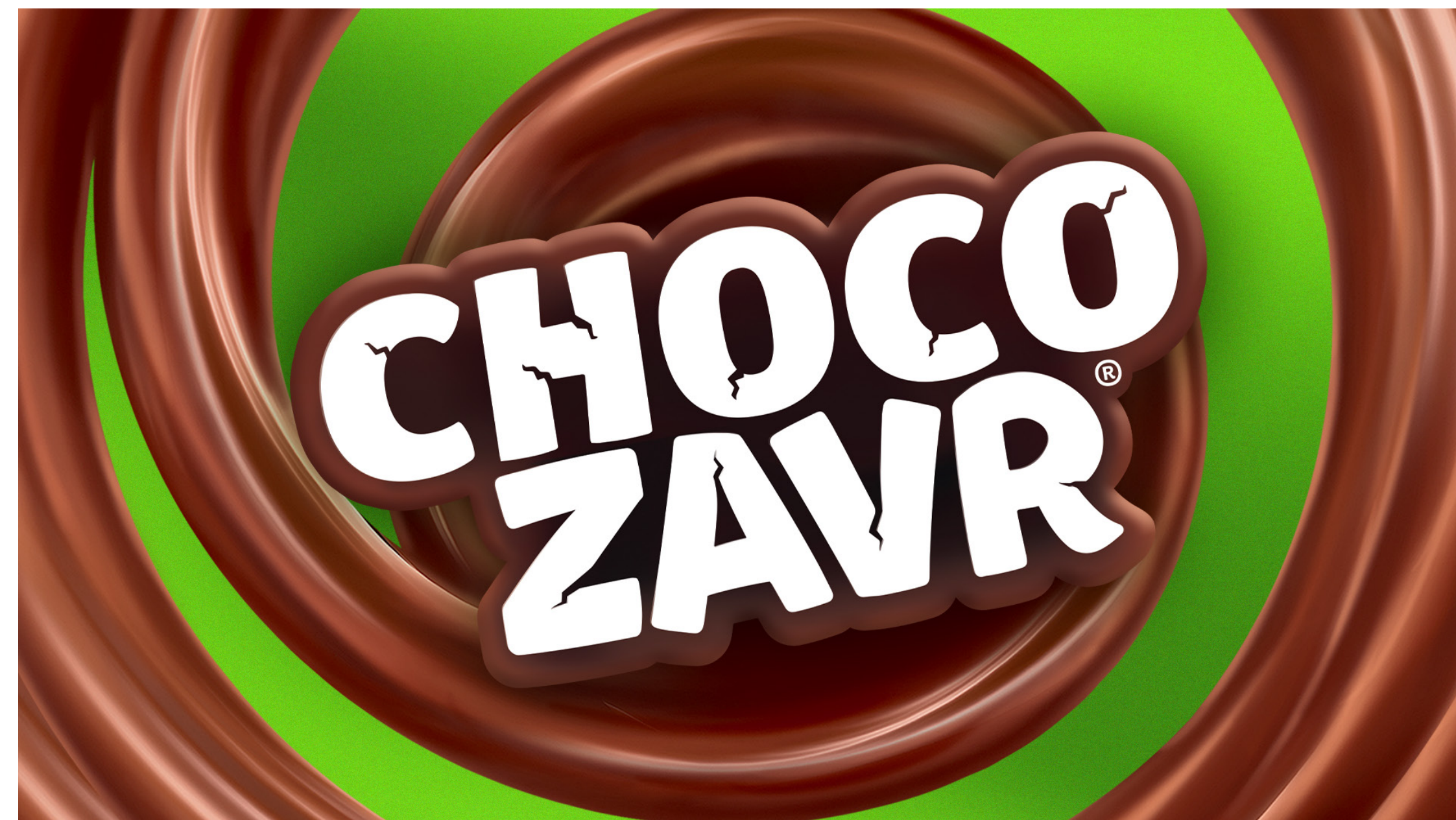
ПРОЕКТ: CHOCOZAVR | КЛИЕНТ: ГК ЧЕРНОГОЛОВКА | КАТЕГОРИЯ: FOOD / KIDS