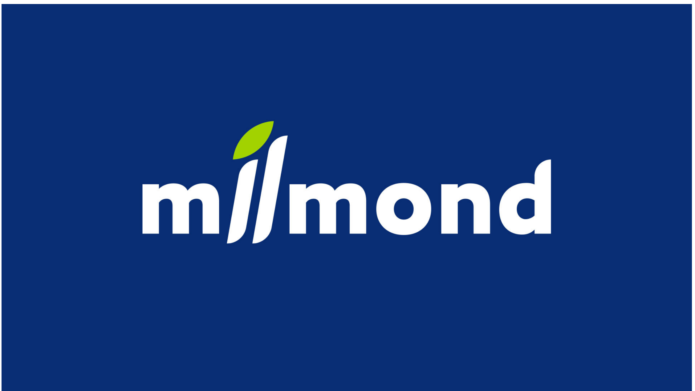
ПРОЕКТ: MILMOND | КЛИЕНТ: МИЛМОНД | КАТЕГОРИЯ: IDENTITY / CORPORATE