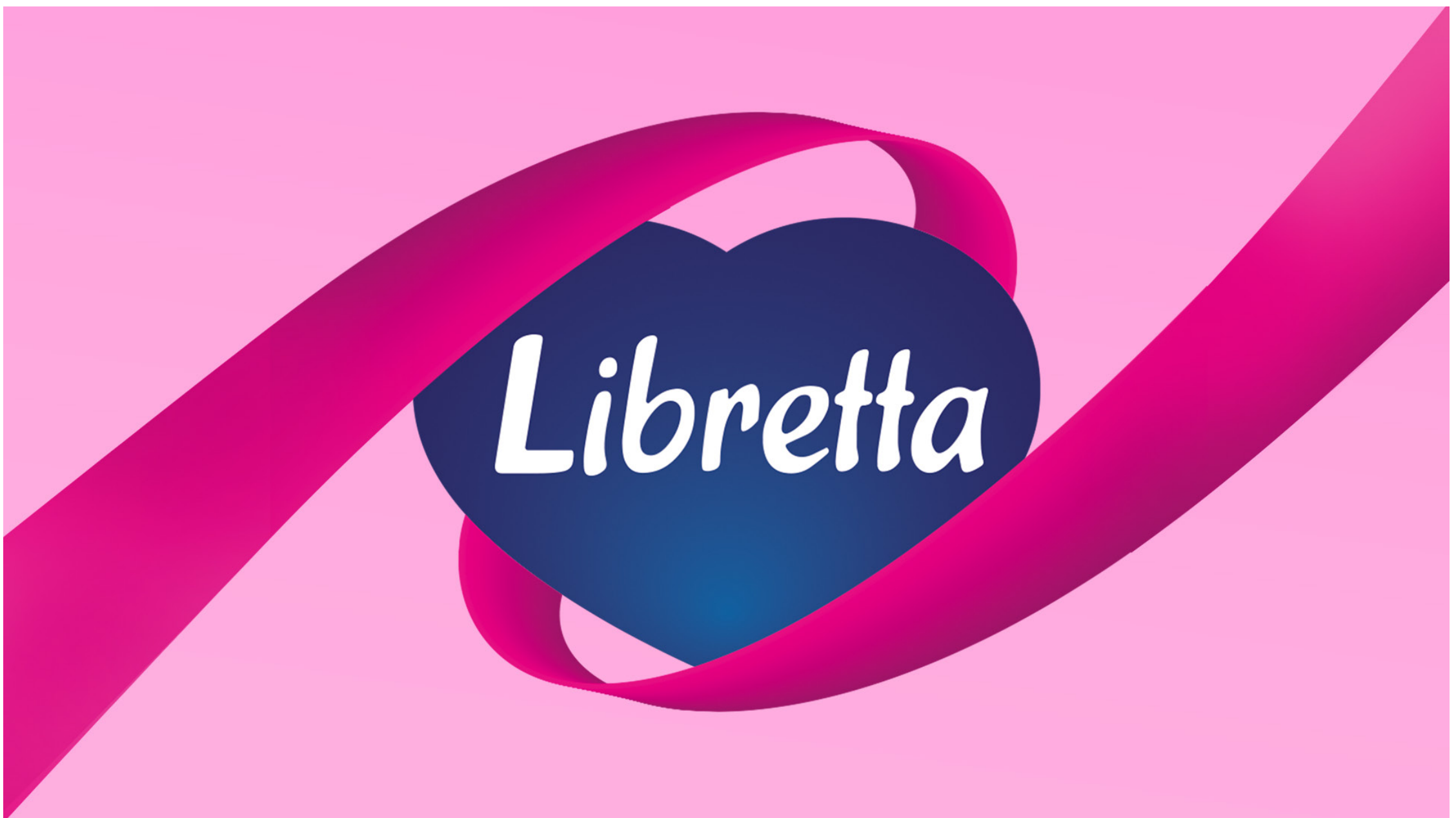
ПРОЕКТ: LIBRETТА | КЛИЕНТ: ЭВОКОМ | КАТЕГОРИЯ: NON FOOD / HYGIENE