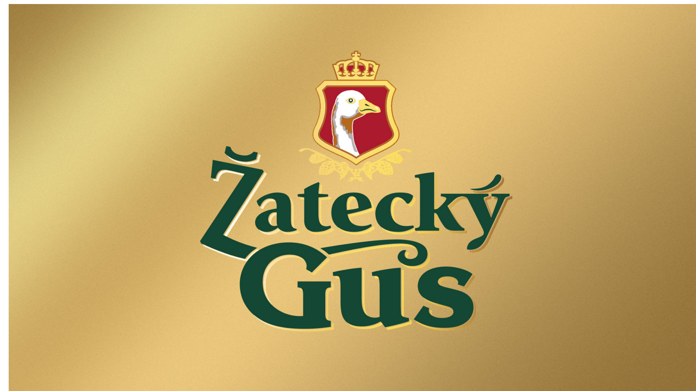
ПРОЕКТ: ŽATECKÝ GUS | КЛИЕНТ: CARLSBERG KZ | КАТЕГОРИЯ: FOOD / ALCOHOL