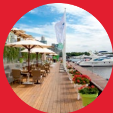
Рестораны премиум класса