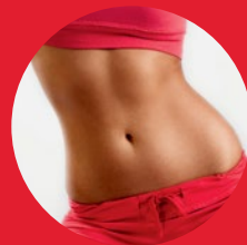
Элитные спортивные клубы