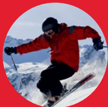
Горнолыжные курорты Москвы, Санкт-Петербурга, Сочи и Европы