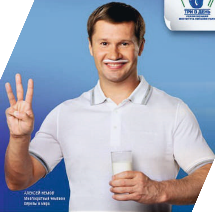
АЛЕКСЕЙ НЕМОВ Многочетный чемпион Европы и мира