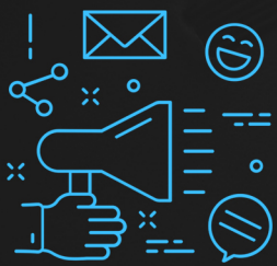
Маркетинг в социальных сетях