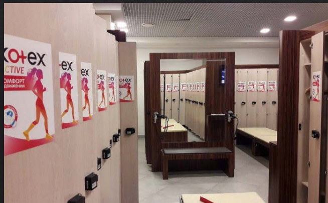
Стикер в шкафчиках