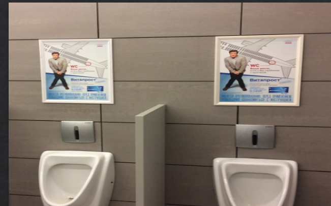
Полиграфия в местах ожидания