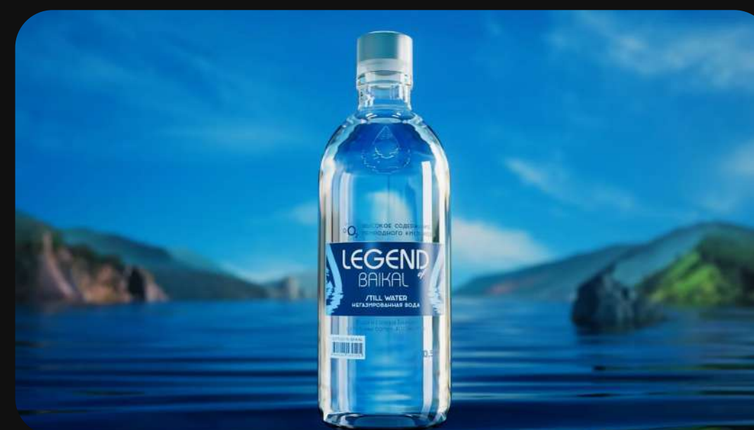
LEGEND OF BAIKAL