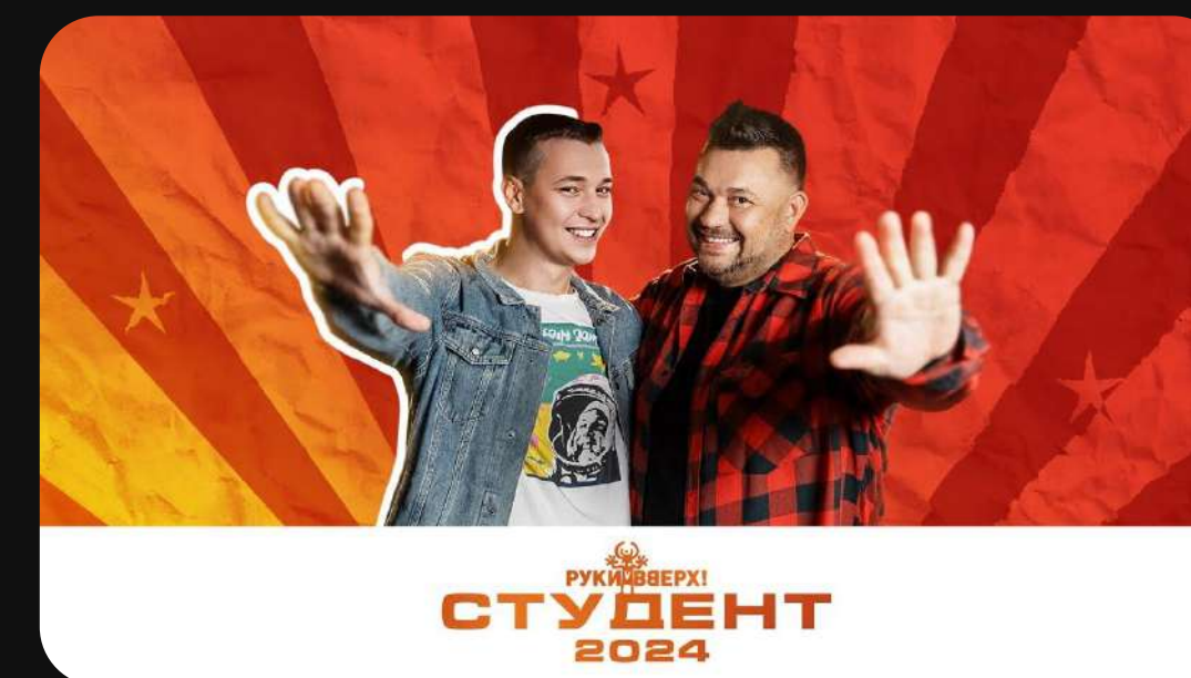
РУКИ ВВЕРХ! "СТУДЕНТ 2024"