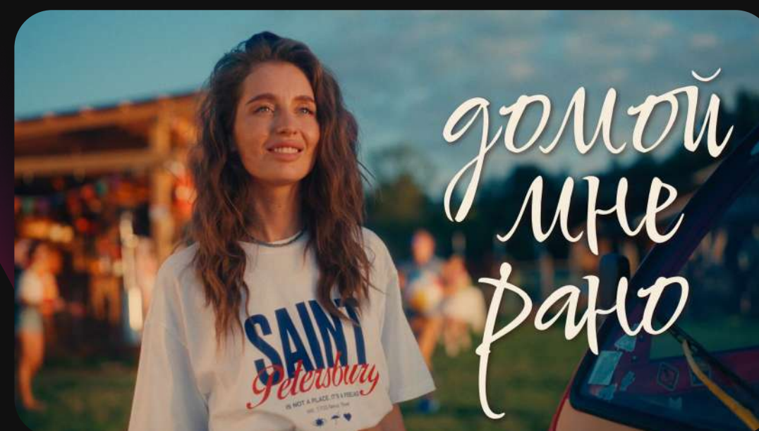
OLISHA - ДОМОЙ МНЕ РАНО